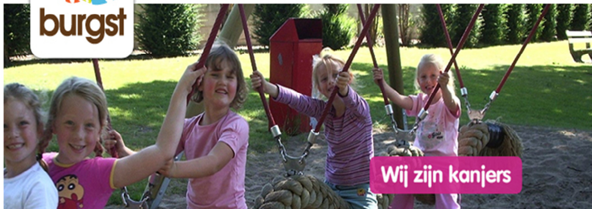
Ouderblad "De Heksenketel" van Nutsbasisschool Burgst. Jaargang 24 nummer 07 16 januari 2014