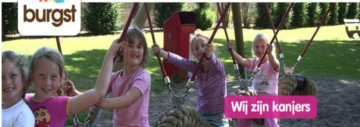
Ouderblad "De Heksenketel" van Nutsbasisschool Burgst. Jaargang 23 nummer 09 24 januari 2013