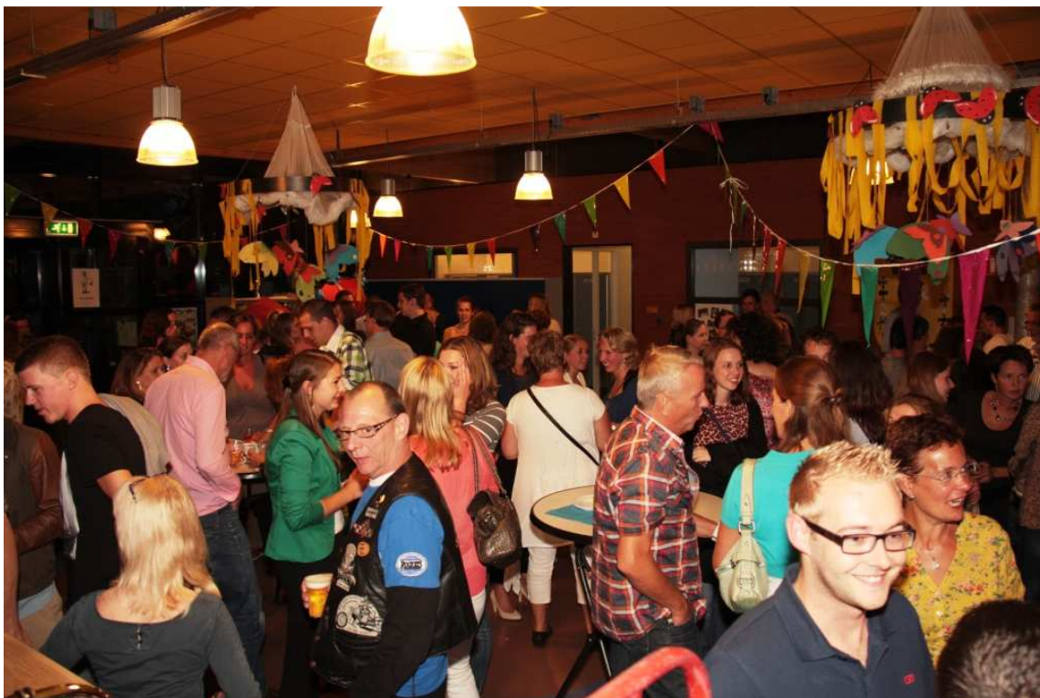
Een heel gezellige sfeer tijdens de reünie!

's Avonds was tot slot een reünie voor alle oud-leerlingen en oud-collega's van Burgst. Bijna 300 oudleerlingen kwamen daar op af en ook dit werd een klinkend succes! Iedereen vond het geweldig om elkaar, vaak na vele jaren, weer terug te zien. Voor ons als team was het bijzonder om te horen hoe het iedereen na de basisschool vergaan is en ook om te horen hoe positief en succesvol dat voor de meesten gegaan is.