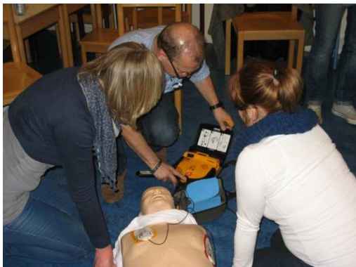
Aansluiten van een AED